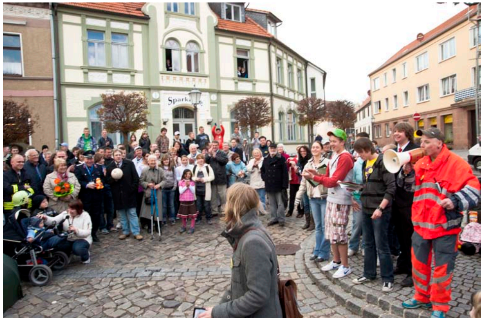
Erfolgreiche Stadtwette: Mehr als 200 Menschen mit Regenschirmen, Blumensträußen, Kinderwagen, über 60 Jahre alt, Anzugträger, Kellner usw. trafen sich auf dem Marktplatz.