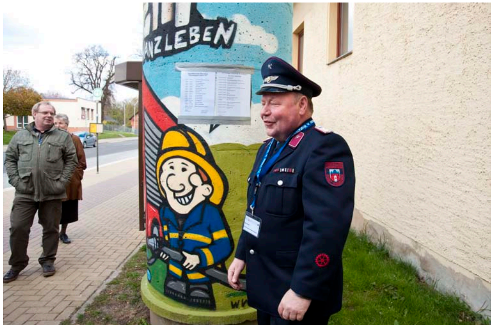
Stadtspaziergang, Litfaßsäule der Freiwilligen Feuerwehr