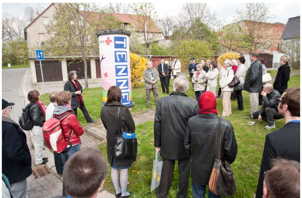
Stadtspaziergang, Litfaßsäule des Jugendclubs „Tenne“, der in Trägerschaft des DRK betrieben wird